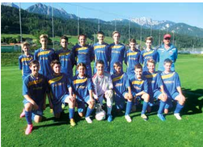
Die U16-Mannschaft des FC Schladming sicherte sich den Meistertitel.

An dieser Stelle möchte der FC Schladming noch ein herzliches Dankeschön an alle Sponsoren des Fußballnachwuchses richten.