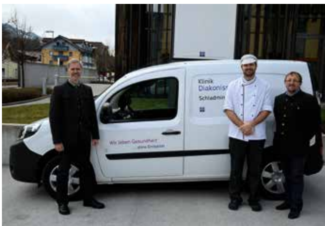
Das Essen wird nun mit diesem Elektroauto ausgeliefert.