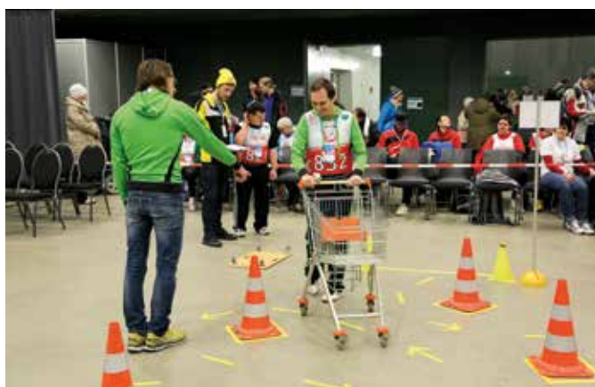
Durchführung des MATP-Bewerbs im Rahmen der Special Olympics Pre-Games im Jänner 2016.

Die beiden Übungsfirmen „BA & BM GesmbH“ und „BLUE TOMATO Handelsges.m.b.H.“ der 4A der Skihandelsakademie Schladming reichten ihre Geschäftsunterlagen des heurigen ÜFA-Jahres zur Zertifizierung (Qualitätsmarke ÜFA 2020) durch die Kommission der ACT (Austrian Center