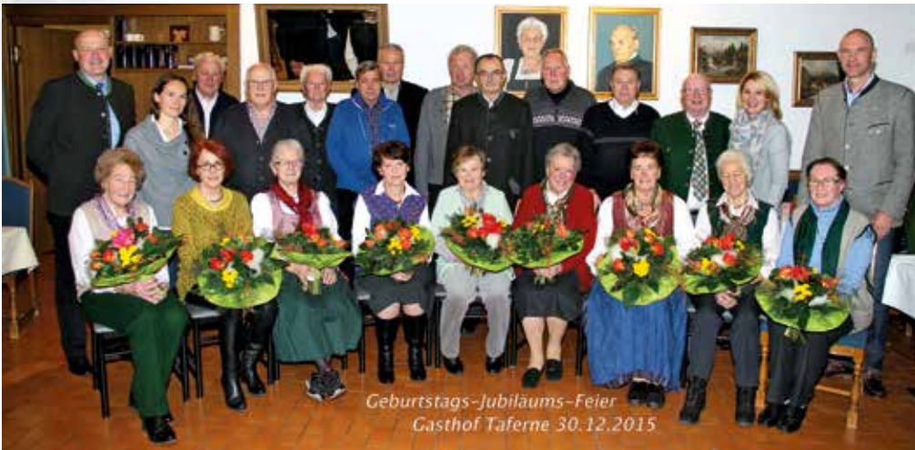
Im Gasthof Taferne fand eine stimmungsvolle Geburtstagsfeier statt. Die Stadtgemeinde gratuliert allen Jubilaren von Herzen!

Zeitraum 26. Dezember 2015 bis 31. Mai 2016