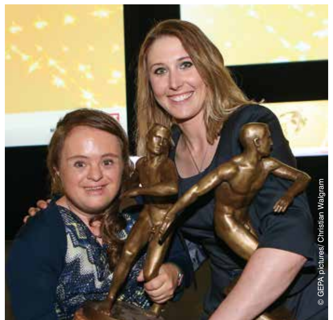
Conny Hütter (rechts im Bild) ist neue Botschafterin für die Special Olympics World Winter Games 2017.

Die meisten Delegationen bekommen zwei Begleiter zur Seite gestellt, größere Mannschaften werden von drei bis fünf Personen betreut. Deutsch und Englisch sind Grundvoraussetzung, aber von den 155 Begleitern, die bereits fix bei den Spielen da-