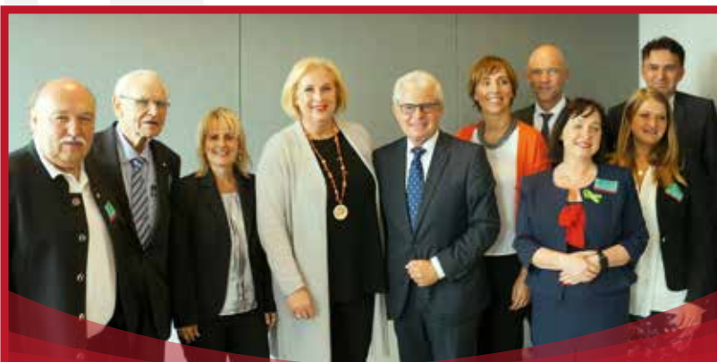
Mitte Juni präsentierte eine Delegation aus Österreich die Winterspiele im Europäischen Parlament in Brüssel

Weitere Special Olympics Neuigkeiten lesen Sie auf den Seiten 16 und 17.