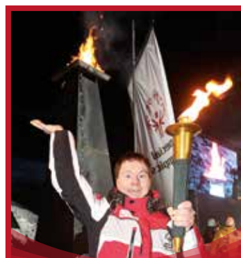
Das Olympische Feuer wurde im Jänner entfacht