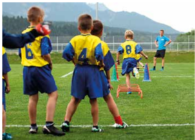
Der Fußball-Nachwuchs beim Training.