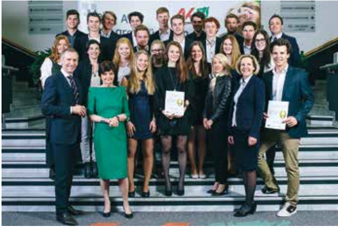
Bei der Überreichung der ÜFA-Zertifizierung in Graz.

for Trainingfirms) ein und bestanden die strenge und exakte Prüfung auf inhaltliche und formale Richtigkeit.