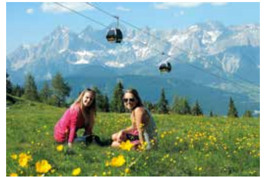
Mit dem Preunegg Jet „auffigondeln“ und herrliche Panoramablicke genießen.