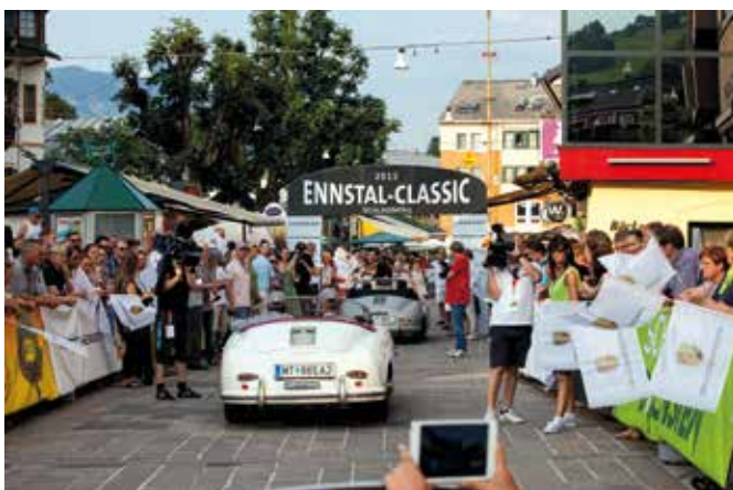
Begeisterte Stimmung bei den zahlreichen Zusehern bei sommerlichen Temperaturen am Schladminger Hauptplatz.