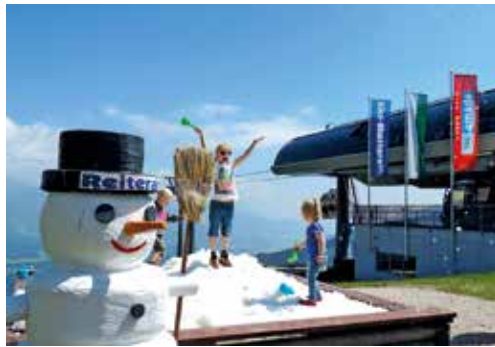
Sommer-Schnee-Spielplatz mit echtem Schnee – ein Spaß für die ganze Familie.

Das Angebot der Fageralm wurde im vergangenen Winter speziell „unter die Lupe genommen“ und vom internationalen Skiareatest-Team anonym getestet. Vier