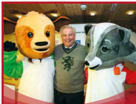
LH Hermann Schützenhöfer mit den Maskottchen bei der Pre-Games-Eröffnung