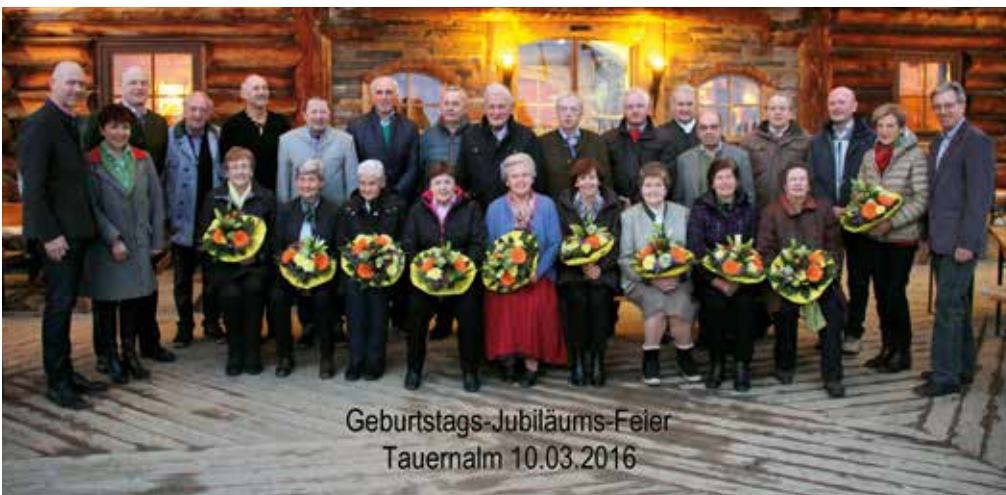
Auf Einladung der Stadtgemeinde trafen sich die Schladminger Jubilare zur Feier ihres Geburtstages im vergangenen März in der Tauernalm.