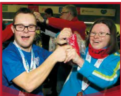
Bei der Schlusszeremonie der Pre-Games