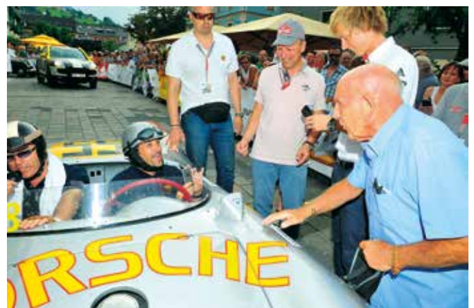
Patrick Dempsey wird von Sir Stirling Moss am Schladminger Hauptplatz willkommen geheißen.