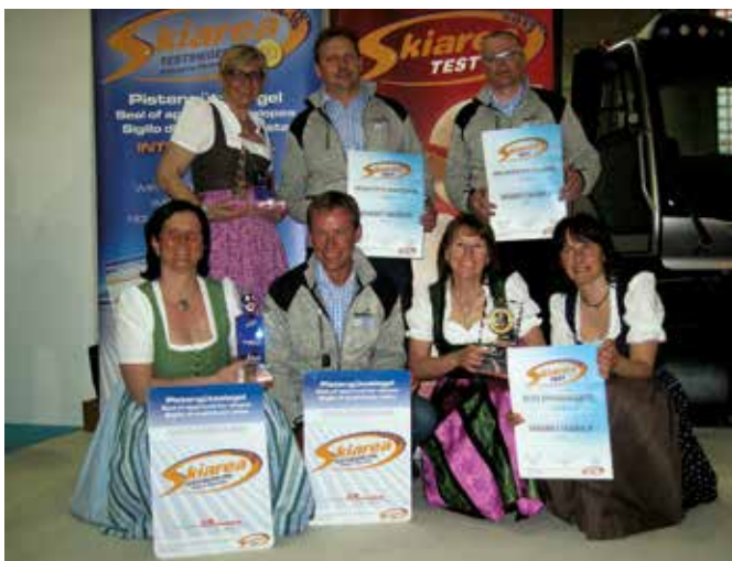
Eine Abordnung der Fageralm-Bergbahnen sowie Vertreter der Skischule und des TVB Forstau bei der Verleihung in Bozen.

Das Team der Reiteralm wünscht allen eine schöne Zeit und freut sich auf euren geschätzten Besuch – Sommer wie Winter!