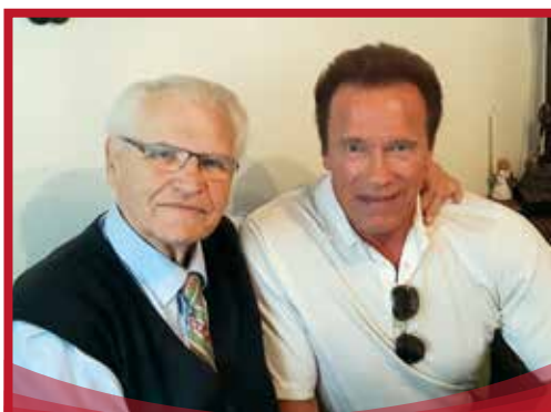
Arnold Schwarzenegger übernimmt Patronanz für die Spiele 2017