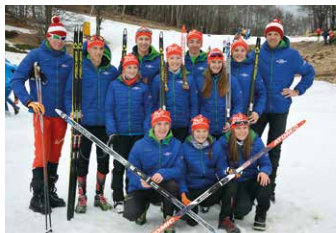
Erfolgreiches Langlauf-Team bei der Schul-WM.