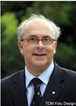
TOM Foto Design